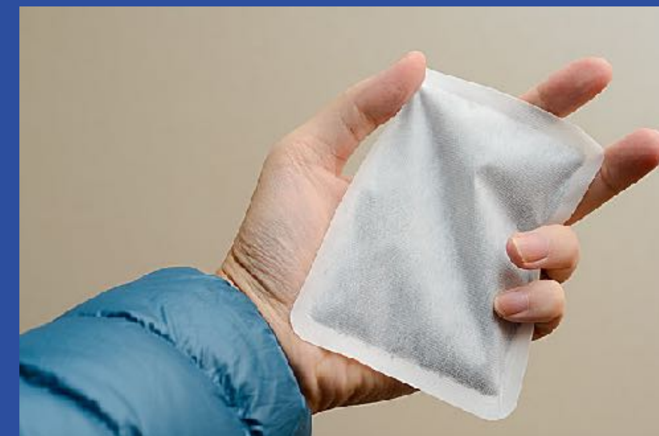
使い捨てカイロ ツアー中重宝します