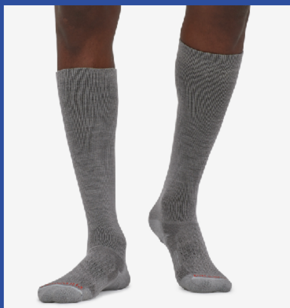
厚手のソックス 足先の保温