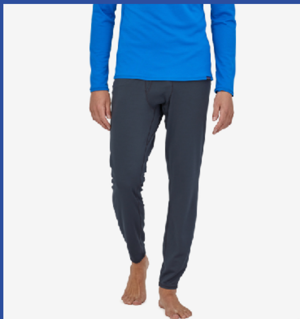
タイツ 下半身の保温

下半身を温めることが保温には効果的です。そのため、地厚のタイツやソックスの着用をオススメします。その他ニット帽や手袋など。また、使い捨てカイロをお持ちいただくと軽くて便利です。