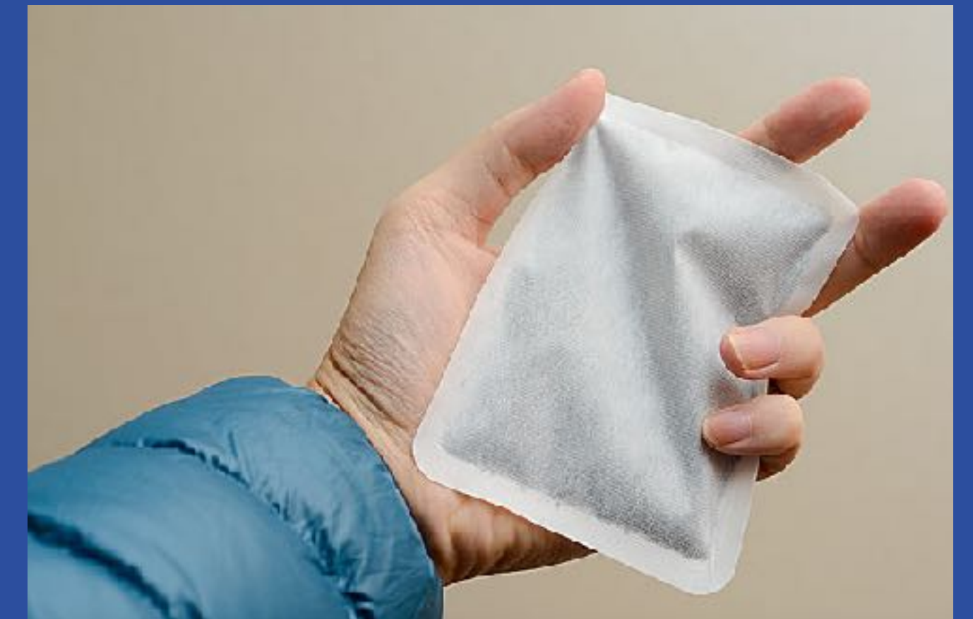
使い捨てカイロ ツアー中重宝します